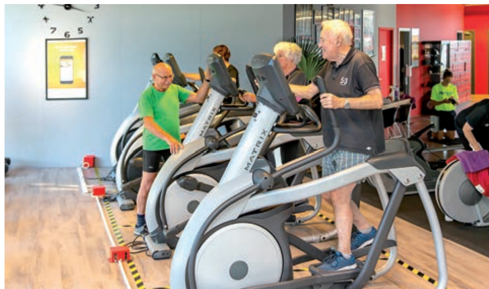
Door op oudere leeftijd aan sport te doen kweek je niet alleen spiermassa. Het kan ook leiden tot nieuwe sociale contacten

Iemand die pas op latere leeftijd wil gaan sporten doet er goed aan om dit langzaam en onder begeleiding op te bouwen. Om risico's uit te sluiten kan het verstandig zijn om vooraf een sport medisch onderzoek te ondergaan, waarbij men een op de persoon afgestemd advies krijgt. Door regelmatig te bewegen, overgewicht te voorkomen en door het eten van gevarieerd en gezond voedsel, wordt de kans op het krijgen van welvaartsziekten kleiner. Een leefstijlcoach kan hierbij begeleiding bieden. Goede genen, een gezonde leefstijl en regelmatig bewegen vergroten de kans om op oudere leeftijd gezond en fit te blijven. Daarnaast is een dosis geluk van onschatbare betekenis. Luidt het gezegde niet 'Zonder geluk vaart niemand wel'?